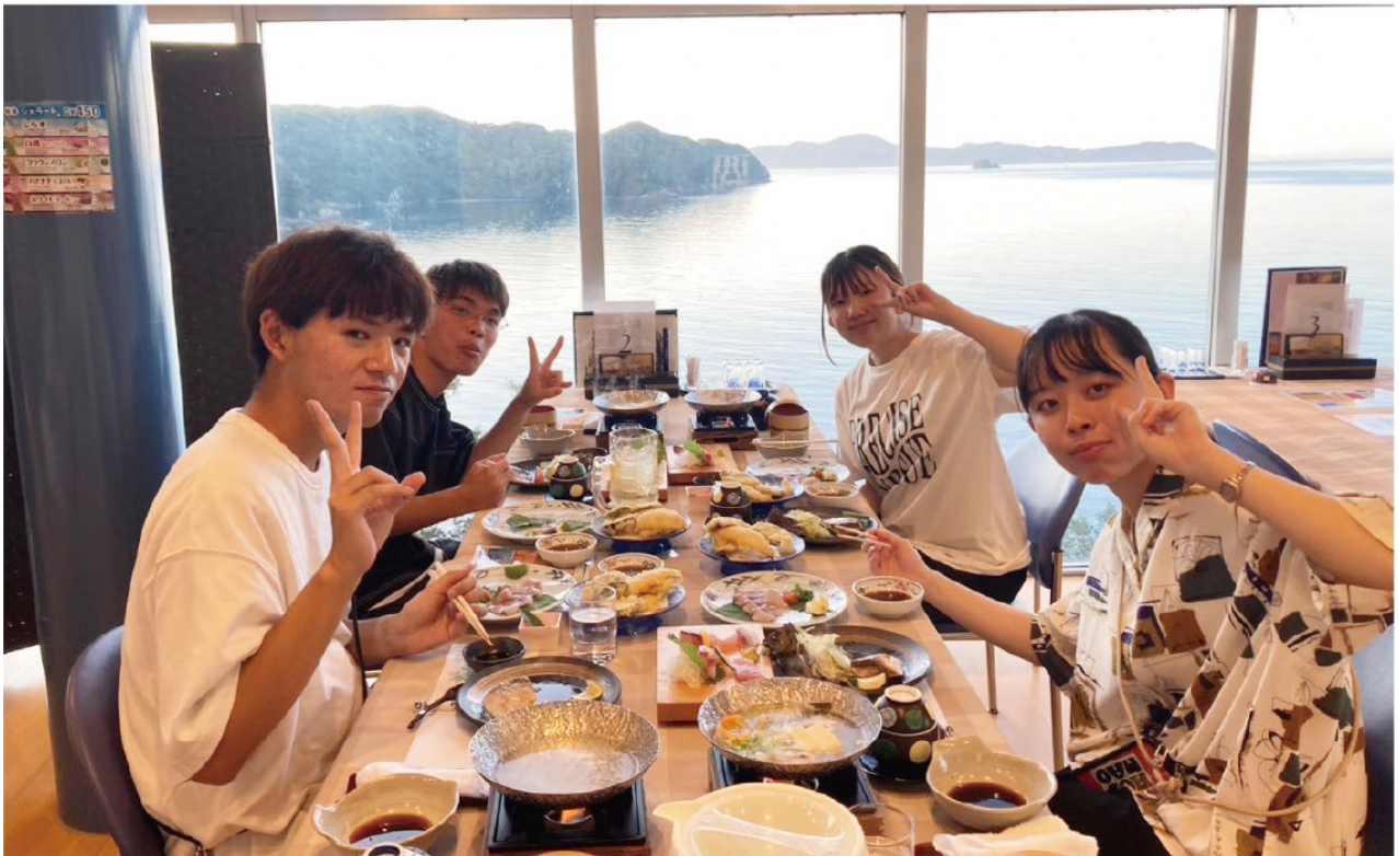
(学生のフィールドワークの様子)

※オープニングセレモニー・その他取材をご希望の方は事前ご連絡いただけますと幸いです。