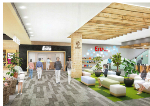
▲内観完成予想イメージ

2001年にオープンした「スポーツクラブエスタ香椎」は、フィットネスクラブ、テニス、スイミングスクール、ホットヨガ、リラクゼーションなどの設備を有し、20年にわたり地域のお客様にご愛顧いただいております。今回の新設する店舗では、アクティブな運動プログラムに加えて、ゆっくりと健康習慣を作りたいシニア、リフレッシュしたい子育て中のママ・パパなど、あらゆる世代のライフスタイルに合わせて利用いただけるよう託児機能も併設し、施設アイテムやプログラムを充実させる予定です。